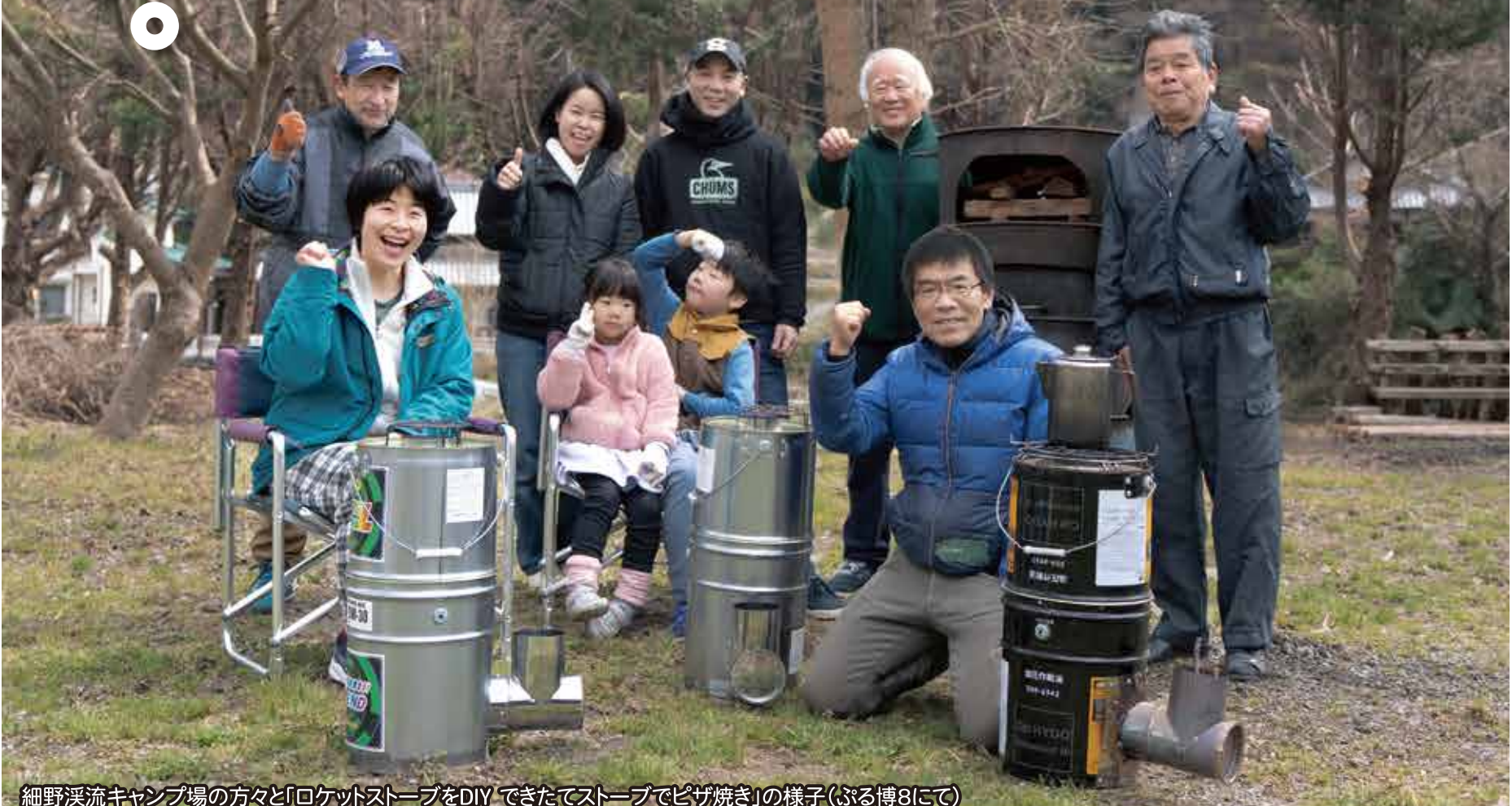
細野溪流キャンプ場の方々と「ロケットストーブをDIYできたてストーブでピザ焼き」の様子(ふる博8にて)

〈貸出窓口の一例〉 ・紀の川市観光交流拠点 紀楽里 ・道の駅 青洲の里 ※電動アシスト自転車有り https://seisunosato.com 〈レンタサイクル予約サイト〉 https://reserva.be/kinokawacycle